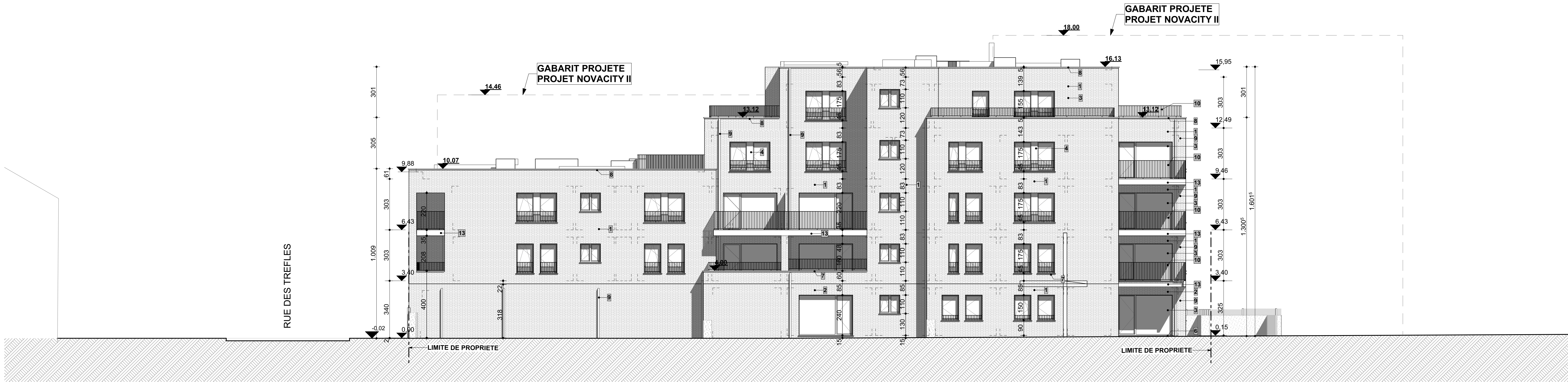
FACADE ARRIERE (N-O)