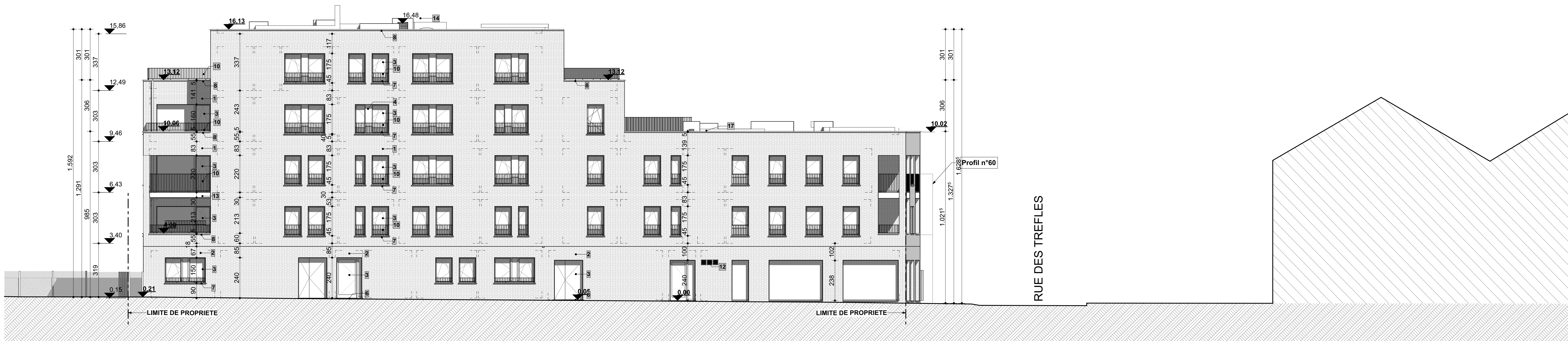
FACADE AVANT - VOIRIE COMMUNALE (S-E)